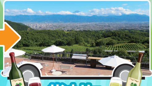
サントリー 登美の丘ワイナリー