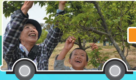
甲州小梅もぎとり体験会場