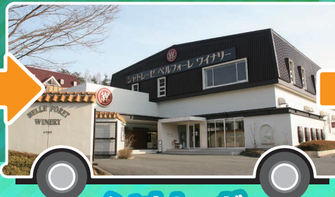
シャトレゼ ベルフォーレワイナリー