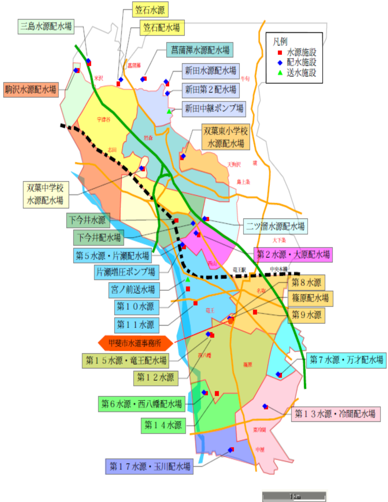
図1 甲斐市上水道 水源・配水場と給水区域