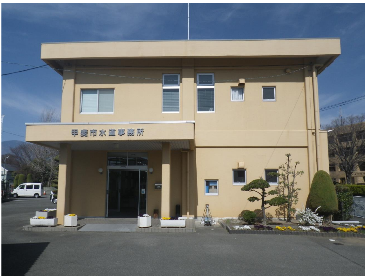
甲斐市水道事務所