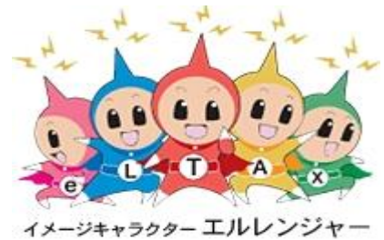
イメージキャラクター エルレンジャー