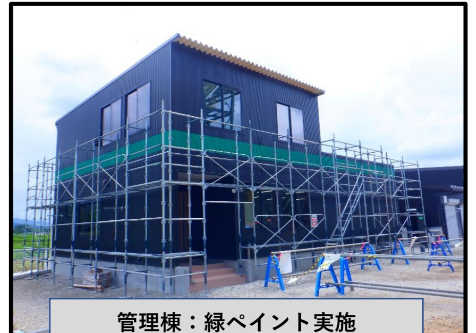
管理棟：緑ペイント実施