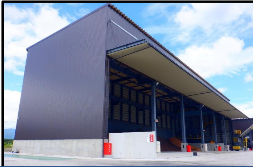
チップ倉庫棟前：倉庫内チップ集荷開始①