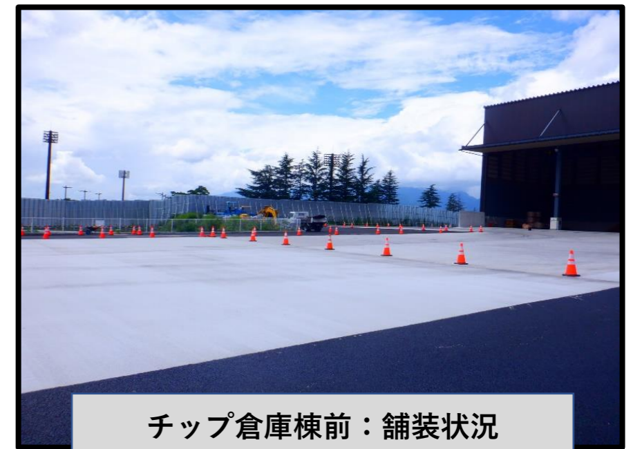
チップ倉庫棟前：舗装状況