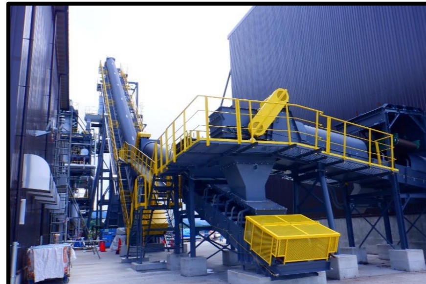
チップ倉庫棟北：燃料搬送コンベア各試験実施