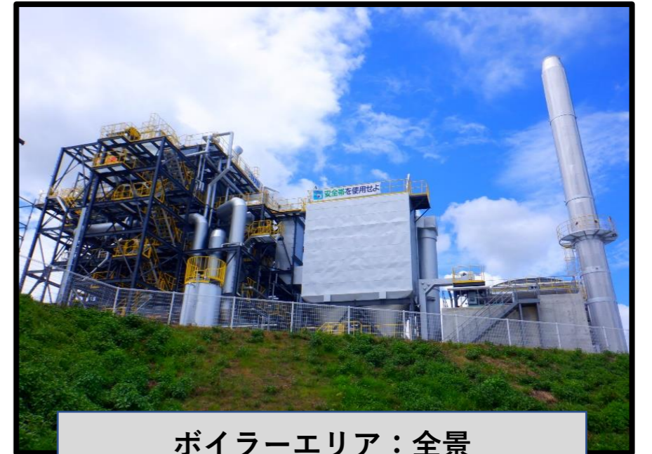
ボイラーエリア：全景