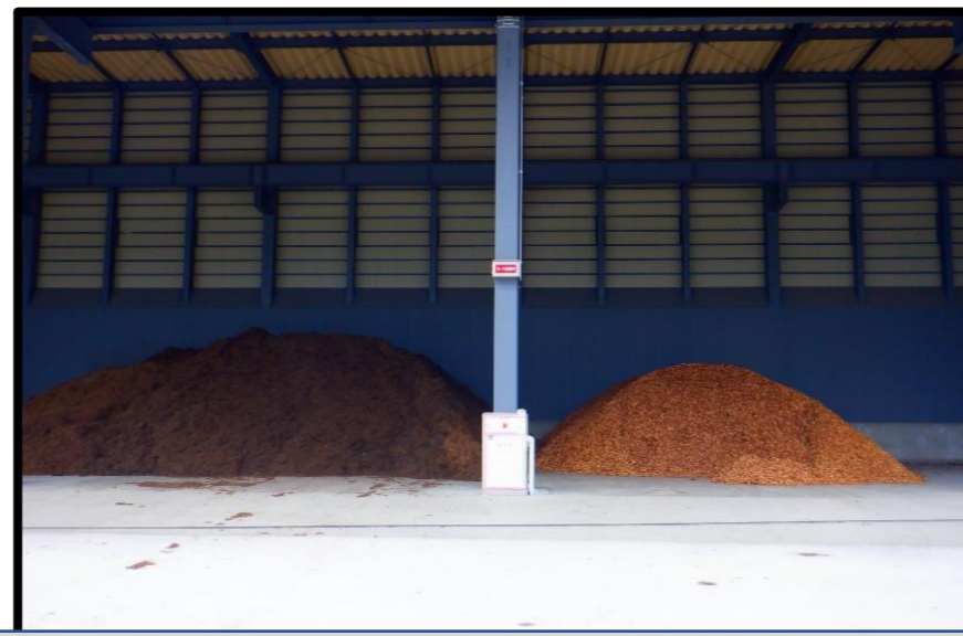
チップ倉庫棟内：倉庫内チップ集荷開始②