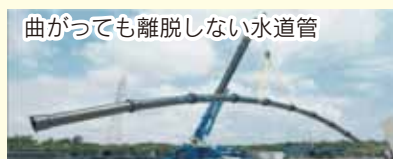
曲がっても離脱しない水道管