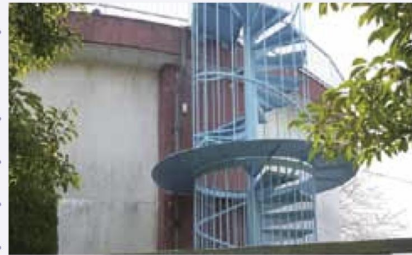
平成24年度 補修工事を予定している万才配水池