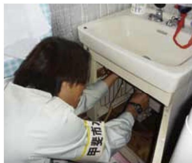
昨年の高齢者世帯水道設備の点検の様子