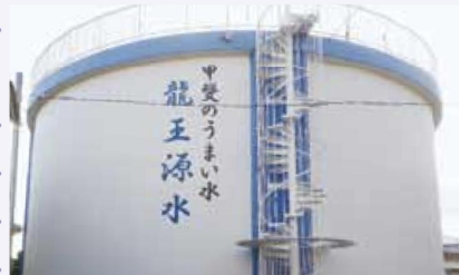
平成23年度に補修工事を実施した篠原配水池