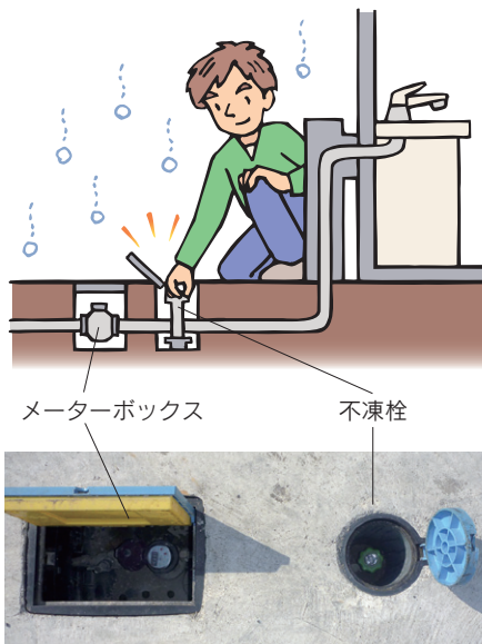
メーターボックス