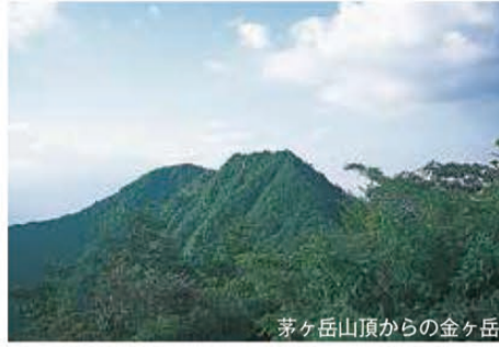
茅ヶ岳山頂からの金ヶ岳

PICA八ヶ岳明野より道標に従い進んでいくと、金ヶ岳登山道入口がある。尾根を登って行くと金ヶ岳山頂手前には岩場があり、注意が必要。岩場を抜ければ、八ヶ岳、茅ヶ岳山頂、富士山、甲府盆地などの眺望が広がる。金ヶ岳山頂より観音峠との分岐点を通り、茅ヶ岳山頂へ。山頂からは360度のパノラマが楽しめる。