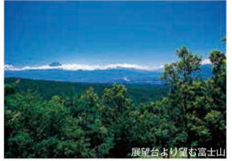
展望台より望む富士山

休憩小屋を過ぎ林道を歩いていくと、千本桜公園が広がる。この桜は昭和30年代初め、地元の老人会が植樹したものだ。公園内には展望台もあり、甲斐駒ヶ岳、富士山、甲府盆地を眺められる。静寂の中、自然に身を委ねてみては。ここから2時間ほどで直接茅ヶ岳へ行ける。