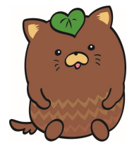
甲斐市マスコットやはいぬ

〒400-0192 甲斐市篠原2610番地 甲斐市役所 都市建設部 都市計画課 緑化推進係 電話番号 055-278-1669（直通）