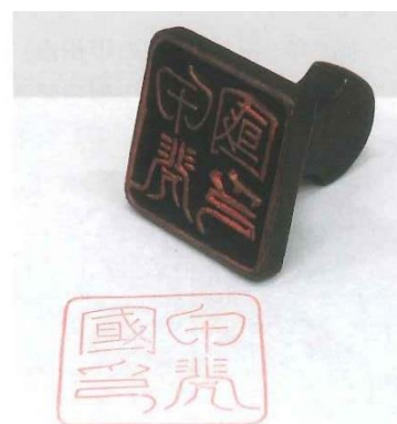
ふくげん 復元した甲斐国印

(参考文献：平川南 2007年「開かれた山国」『山梨の人と文化(山梨学講座)5』ふるさと文庫)