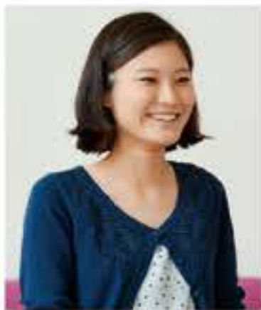
「やはたいぬ」制作者 マスコットキャラクター 最優秀賞受賞

想いを込めて制作した「やはたいぬ」ですが、これから市民の方々にお目にかかる機会が多くなると思います。みなさんに寄り添い、ともに成長していくてくれることを願っています。