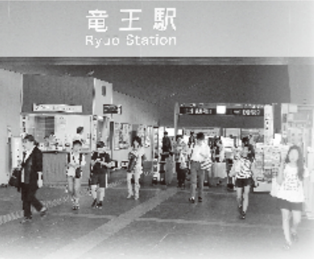
竜王駅 Ryūō Station

市では、平成18年度から平成27年度までの10年間を計画期間とする「第1次甲斐市総合計画」により、総合的なまちづくりを展開しています。