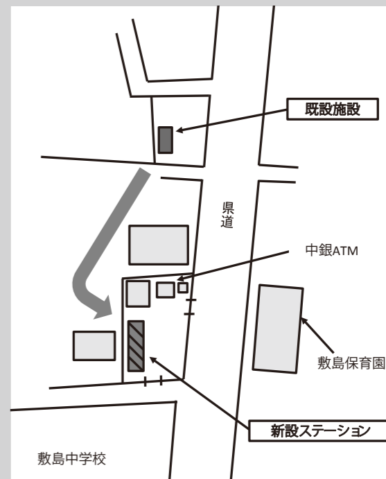
敷島リサイクルステーション位置図