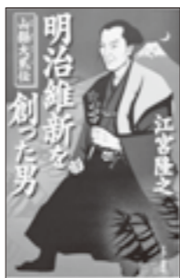
『明治維新を創った男 山縣大貳伝』