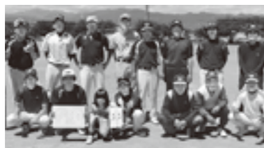
Bパート 優勝 下八幡2区