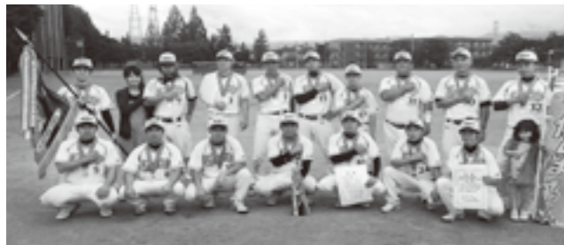
優勝した甲斐市のメンバー

6月14日(土)～28日(土)にかけて釜無川スポーツ公園他で開催され、甲斐市が見事優勝を果たしました。