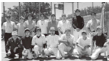
Aパート 優勝 下八幡1・3区