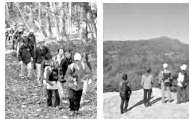
秋の自然を楽しみましょう