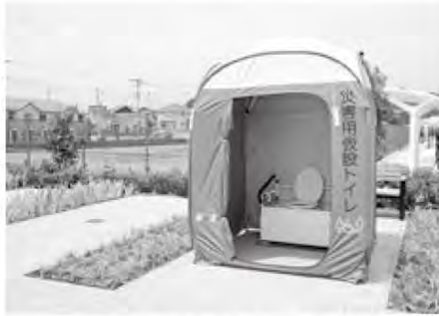
防災機能を備える島上条公園(志麻の里フレンドパーク)

東海地震など大地震の発生が懸念されるなか、災害時に備え防災対策を進めています。地震ハザードマップを策定、全世帯に配布し揺れと液状化により想定される被害の危険度を周知しました。 また、生活必需品の調達など災害時の協力体制について協定を各種団体と締結したほか、災害時には、地域住民の安心・安全の拠点施設として活用できるよう、耐震性貯水槽、備蓄倉庫、マンホールトイレやカマドに転用できるベンチなどを備えた島上条公園(志麻の里フレンドパーク)を整備したことにより非常時の防災体制を強化しました。