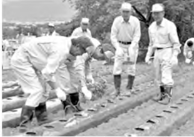
赤坂台地区内の畑でさつまいもの植え付け