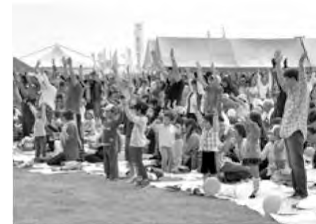
5万8千人の集まるわくわくフェスタでのラジオ体操

安心して子育てができるよう、ファミリーサポートセンターや子育て支援センターでの育児相談、支援、情報提供など子育て中の家庭や働く親をサポートしています。 また、「自らの健康は自らが守る」を基本に、健やかな生活が送れるよう取り組みとともに、健康意識の向上と健康管理に対する正しい知識の浸透に取り組んでいます。特にラジオ体操は、習慣づけることで体力向上、健康増進が期待でき、老若男女を問わず、無理なく続けられる運動として、さまざまなイベントをとおして、積極的な普及に努めています。