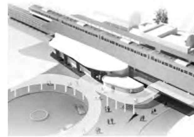
平成26年9月完成予定の塩崎駅新駅舎