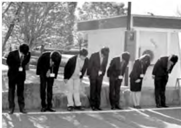
新任職員による朝のあいさつ運動

窓口サービスの一層の向上を目指して、市民の申請手続きの負担軽減などを図り、総合窓口を開設しました。また、フロアマネージャーの設置により、来訪する市民を迅速・的確に案内・誘導できるよう努めています。 市民協働のまちづくりを充実させるため、市民対話集会を行い、意見を気軽に行う機会を提供することで、双方のやりとりを推進しています。さらに、各種政策を推進する過程では、広報誌やホームページを利用したパブリックコメントを実施し、市民ニーズの把握に努めています。