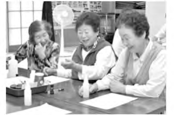
気軽に参加できる体験型教室

市民一人ひとりが豊かさや、ゆとりを実感できる生涯学習社会の実現に努めています。各種講座・教室の開催を通じて、生涯学習の機会を提供しています。現在、開催中のやまなし国文祭では甲斐市主催事業として、創作ミュージカルなど4つの事業を行っています。 また、いつでも身近なところでスポーツに親しみ、活力ある暮らしができるような環境の整備に取り組んでいます。毎年、開催されているチャレンジデーでは、運動を日常生活の習慣として取り入れてもらう活動を行い、高い参加率を得ています。