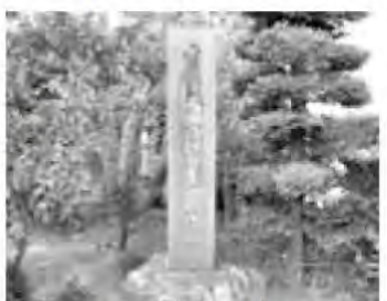
山県昌樹宅址(竜王新町)

その後、昌樹は駿河国丸子(静岡県静岡市)で暮らし、寛政12年(1800)に亡くなるまで、野沢豊後(注1)の名で医業を営んでいました。(注1)母方の祖先が山県と名乗る前の名