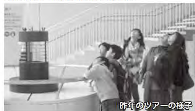
昨年のツアーの様子