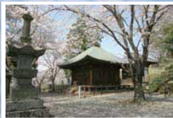
▲光照寺薬師堂と桜