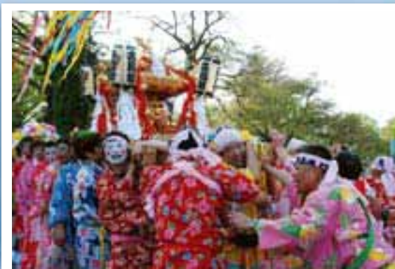
▲春を呼ぶおみゆきさん