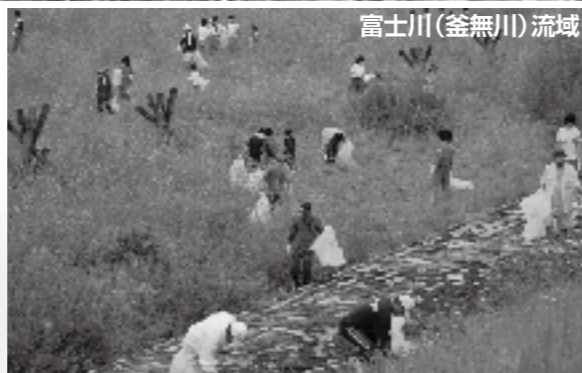
富士川(釜無川)流域