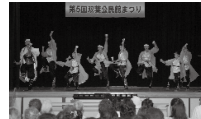
第5回双葉公民館まつり

大規模な自然災害の発生に備え、韮崎警察署や消防本部などから約100人が参加した訓練が矢木羽湖周辺で行われました。訓練は、市内の北部地域で大雨により起きたがけ崩れや河川のはらんにより、一部の地域住民が孤立したことを想定。バイク隊や県警のヘリにより被災地の状況を確認した後、孤立した住民のヘリによる救出訓練や、ザイルを使用して対岸に取り残された住民を救出する訓練などが行われました。