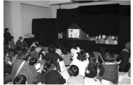
昨年のおはなし会の様子

日時 3月7日(土) 午前10時～午後5時 3月8日(日)～15日(日) 開館時間中 場所 双葉図書館内特設コーナー 内容 雑誌のバックナンバー(2004 年1月～12月)を1冊10円 で販売(なくなり次第終了) ■問い合わせは… 双葉図書館 ☎0551(20)3669