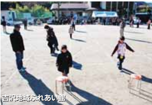
吉沢地域ふれあい館