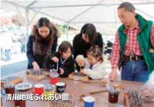
清川地域ふれあい館

清川・吉沢各地区において地域ふれあい館祭りが開催されました。清川ふれあい館では、地域の特色を生かしながら、ワインビーフやバームクーヘンが当たる玉子探しゲーム、ポニーや馬の乗馬体験、革細工工房などのイベントが行われました。また、お祭りの最後に行われたピアノ・バイオリンコンサートで