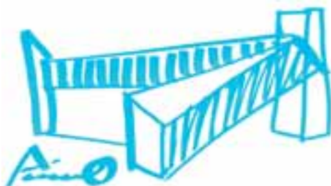
安藤忠雄さんによるラフスケッチ