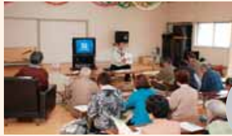
12月に竜王新町上公民館で開かれた講座の様子

何か集まりごとがあるときなどを利用して、みなさんも認知症について一緒に考えてみませんか。