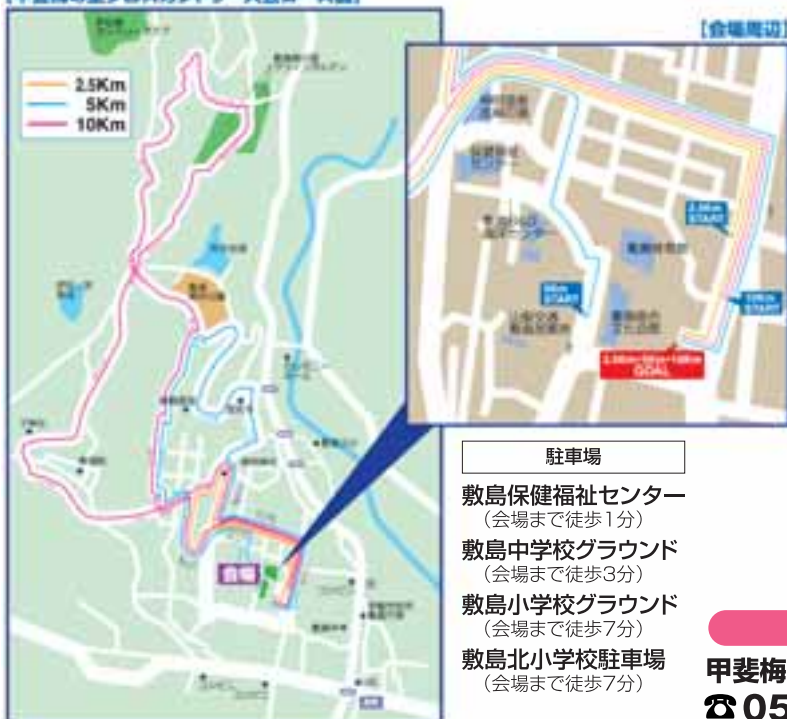
【甲斐梅の里クロスカントリー大会コース図】