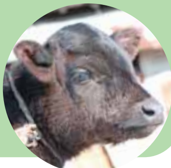
● 昨年の秋に産まれた子牛