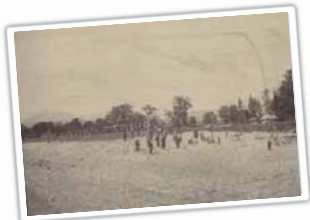
● 明治時代の大洪水以後に修復された堤の様子。現在の堤の原型がみられる。

県立博物館において「信玄堤」展が、1月19日(月)まで開催されています。堤を守り維持していくための決めごとを記した古文書や、昔の堤の姿を描いた絵図など、貴重な実物資料が展示されています。 また、今月号の歴史探訪(P11)では、信玄堤にちなんだ「旧竜王河原宿石橋」を紹介しています。 うし年の今年、聖牛が守ってきたわがまちの貴重な遺産「信玄堤」に改めて目を向けてみてはいかがでしょうか。