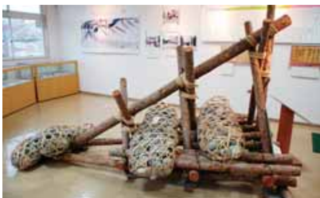
● ドラゴンパーク展望塔には聖牛の縮小模型が展示されている。