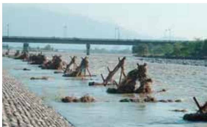
● 台風の去った後の様子。聖牛を境に水の流りが変わっているのがわかる。