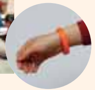
サポーターの証のオレンジリング

「もし、道で会った近所のおじいちゃんの様子がおかしかったら…」など、具体的に身近な事例を挙げながら、認知症について学びました。