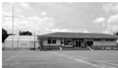
敷島B&G海洋センター

企画課(竜王庁舎2階) ☎055(278)1662 施設の詳細については、教育委員会スポーツ振興課(双葉公民館)へお問い合わせください。 ☎0551(20)3656