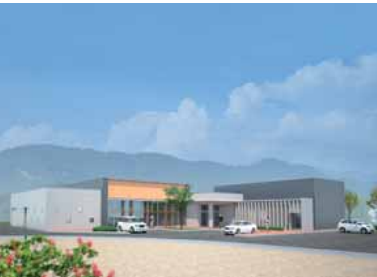
▲敷島支所のイメージ

今月号では、庁舎整備に向けての基本理念や、庁舎の配置および基本的機能など、計画の概要についてお知らせします。