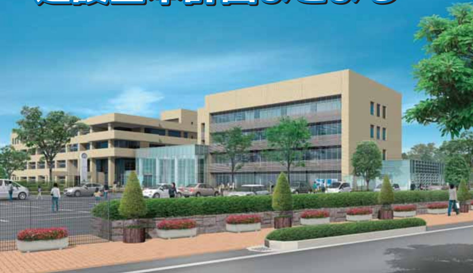
▲本庁舎のイメージ

現在、本市の市役所庁舎は、竜王・敷島・双葉各庁舎に事務を分散する分庁舎方式を採用し、旧町の町役場を庁舎として活用しています。