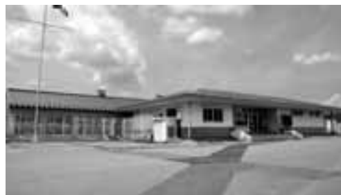
双葉B&G海洋センター