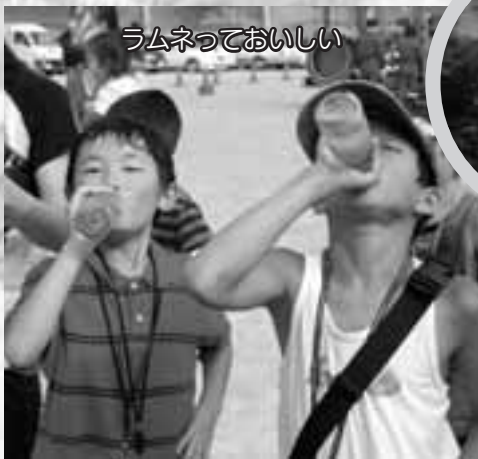
ラムネっておいしい