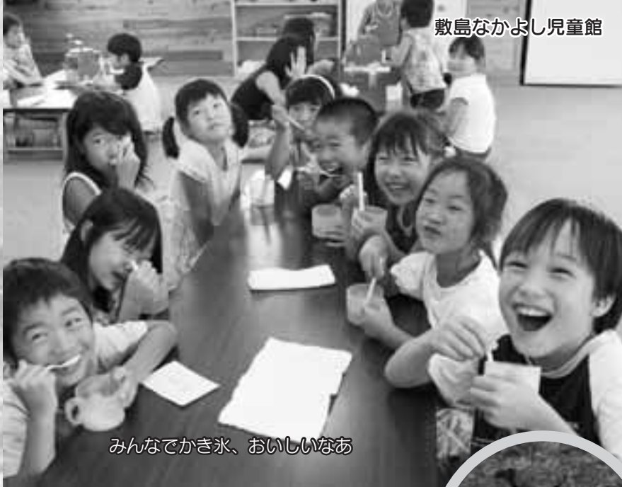
みんなでかき氷、おいしいなあ