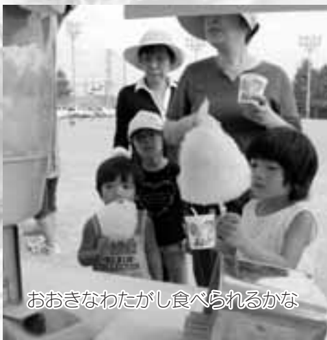
おおきなわたがし食べられるかな