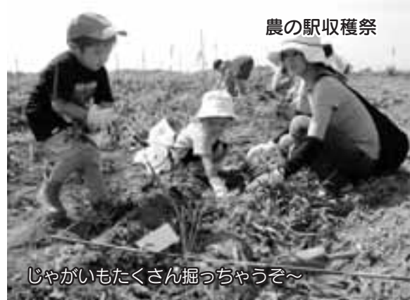
じゃがいもたくさん掘っちゃうぞ〜