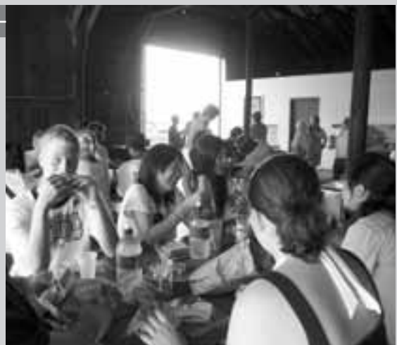
ホームステイ先の手作りランチでひと休み