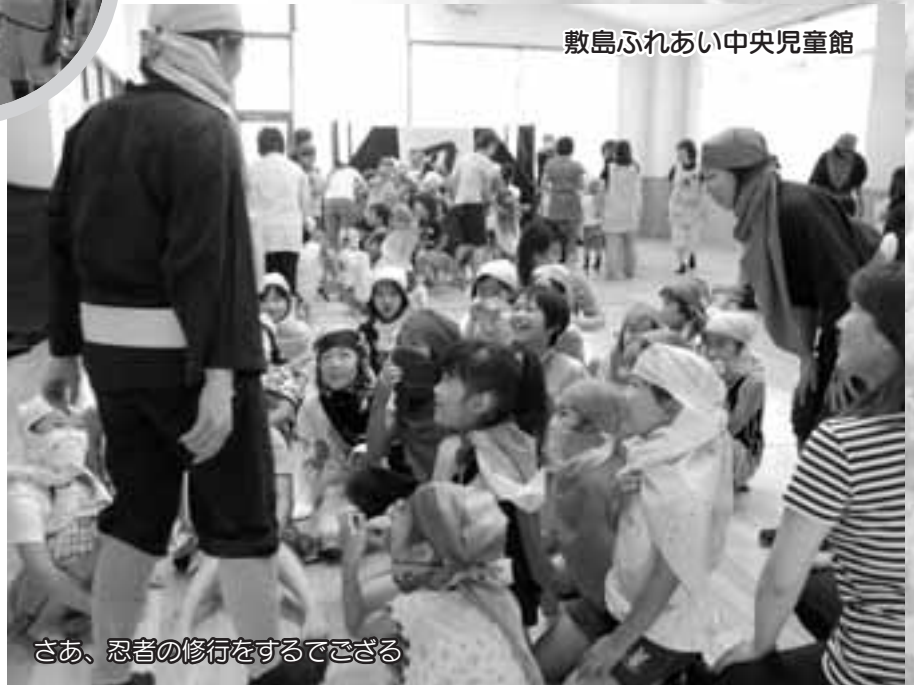
さあ、忍者の修行をするござる