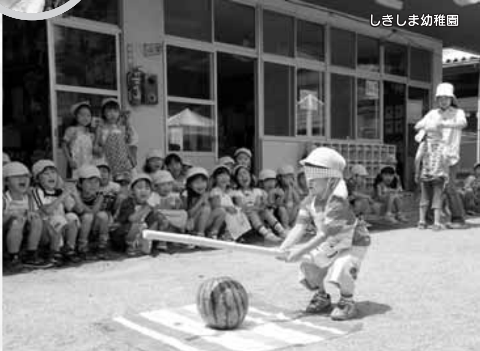
とまって、とまって、そこだよ!