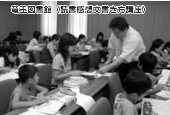
竜王図書館 (読書感想文書き方講座)