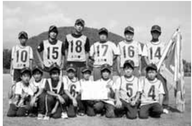
ソフトボール優勝 上八幡チーム