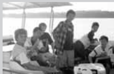
ミシシッピー川にて