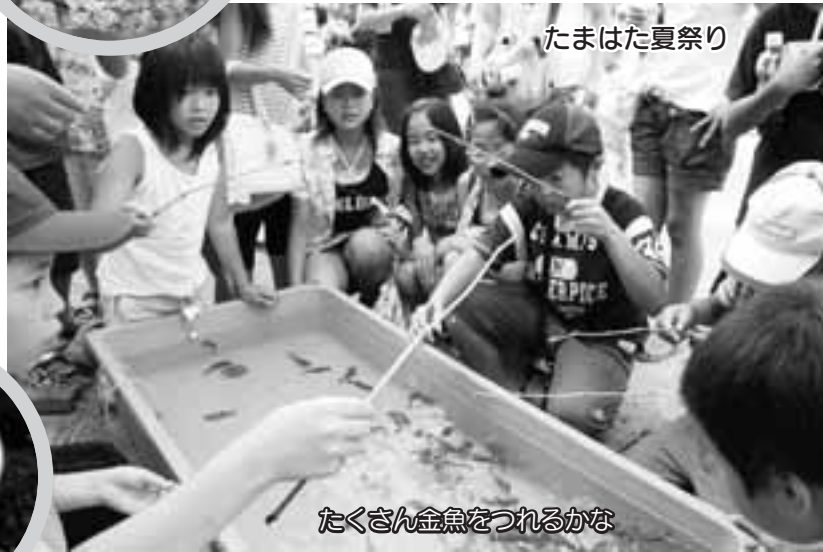
たくさん金魚をつれるかな