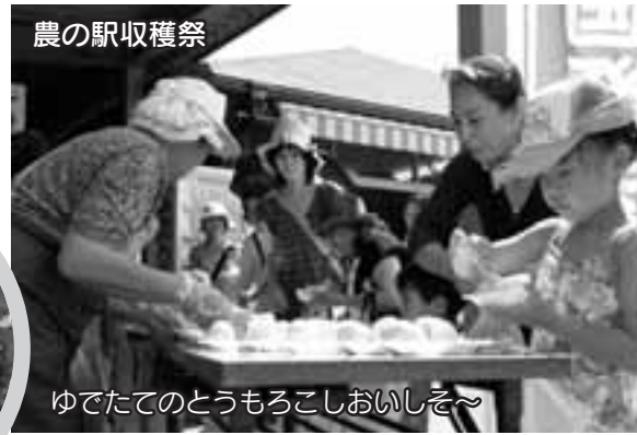
ゆでたてのとうもろこしおいしいぞ〜