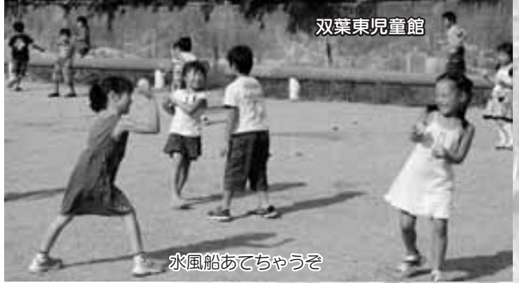
水風船あてちゃうぞ