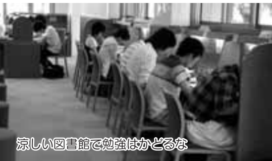
涼しい図書館で勉強はかどるな