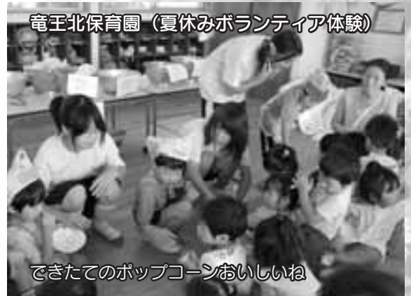
できたてのポップコーンおいしいね