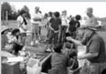
遺跡の発掘に挑戦

市内の中学生10名が、7月25日から17日間の日程で甲斐市の姉妹都市であるキオカック市へ行き交流を深めて来ました。子どもたちは異国の文化に触れ、貴重な体験をしました。また、8月7日には学校間交流として10名の中学生たちがタラマラハイスクールへ短期語学留学に出発しました。