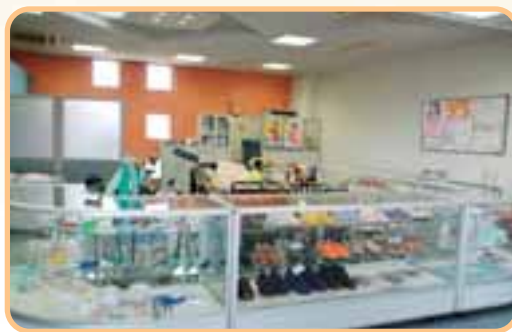
竜王在宅介護支援センターでは、靴や介助用食器、 トイレなどさまざまな福祉用具の展示をしています。