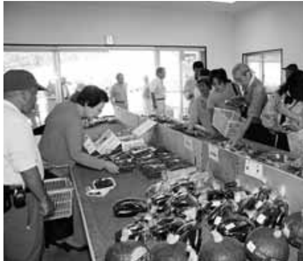
甲斐敷島梅の里クラインガルテンの指定管理者が運営する「ゆうのう市場」

委託への移行など 指定管理者制度の活用 甲斐敷島梅の里クラインガルテン指定管理者導入など 市民との協働の推進 男女共同参画の推進、市民公募制の推進、パブリックコメント制度の導入など