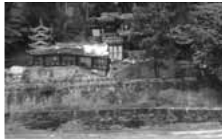
崩れ落ちた二王廟 (都江堰の建造者、李冰親子の記念館)