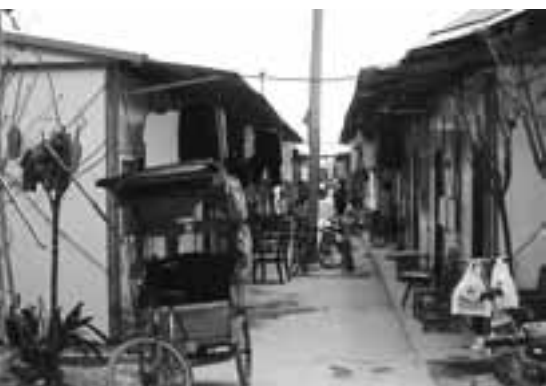
避難所生活の様子