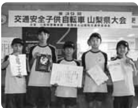
[準優勝メンバー] (敬称略)

市代表として竜王小学校の子どもたちが参加し、 韮崎警察署管内としては初めて準優勝 しました。