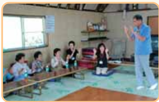
脳のいきいき教室の様子。 みんなで楽しくゲームをしながら、頭の体操をします。