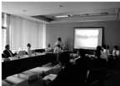
7月14日に開催された協議会での視察結果報告の様子

また、防災訓練はいつもの恒例行事という意識ではなく「まさか」のときのために、より多くの市民のみなさんに参加してほしいと思いました。