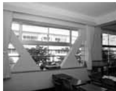
校舎の耐震強度を増すためのブレス