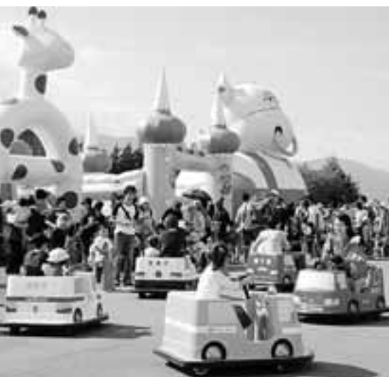
新たに市を代表するイベントとして始まった「わくわくフェスタ」