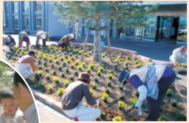
秋:花壇への植花作業