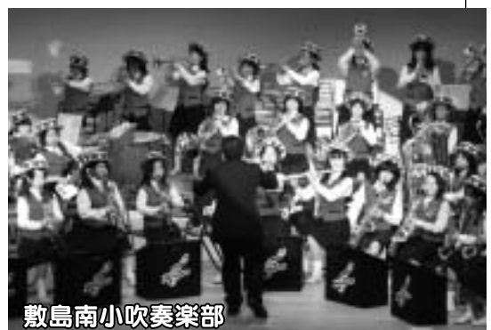
敷島南小吹奏楽部