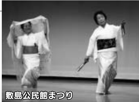
敷島公民館まつり

3月1・2日、敷島公民館まつりが行われ、公民館利用者団体などが社交ダンスや舞踊、大正琴などの舞台発表を行い、短歌や絵手紙、パッチワークなどといった作品の展示がされました。また、吉沢子どもクラブのメンバーが栽培・収穫したもち米でついた、つきたてのお餅が来場者に無料で振舞われました。