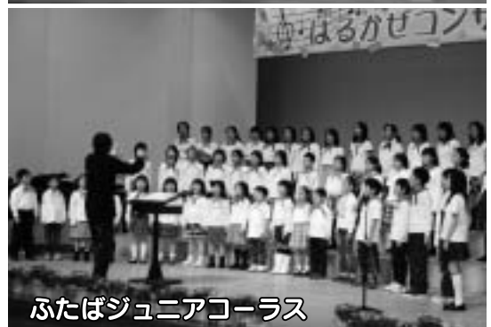
ふたばジュニアコーラス