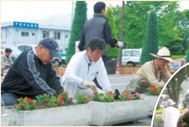
春:プランターへの植花作業