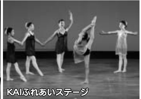
KAIふれあいステージ