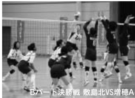
Bパート決勝戦 敷島北VS増穂A

2月24日(日)から3月12日(水)にかけて大会が開催され、市内のチームが大活躍しました。Bパート