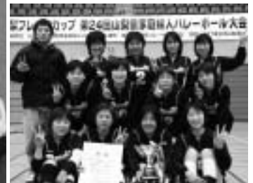
写真下: 竜北ドリーム