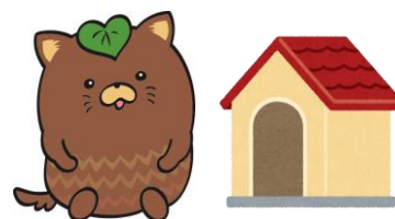
甲斐市マスコットやはたいぬ